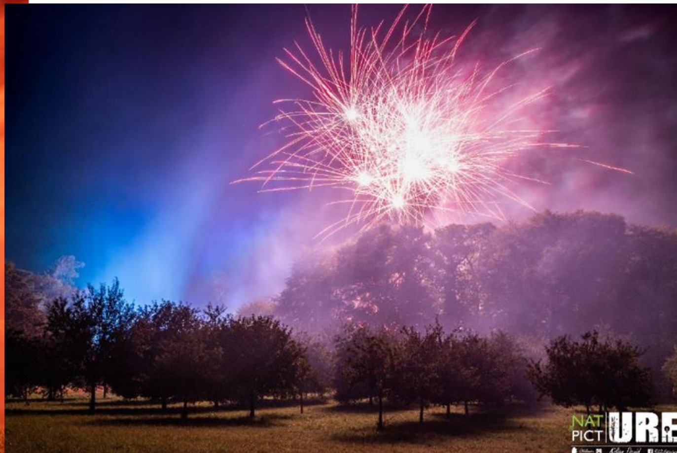
Figure 2 - Photographie du feu d'artifice depuis le point d'observation